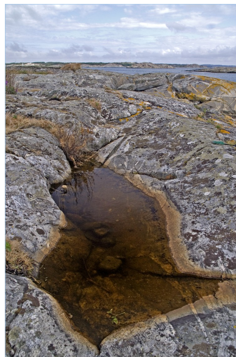
Typiskt hållkar med förekomst av stinkpaddedyngel längs med den högra sidan.